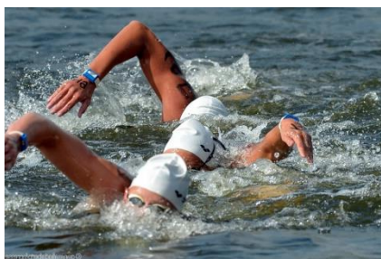
Surf race (course de nage)