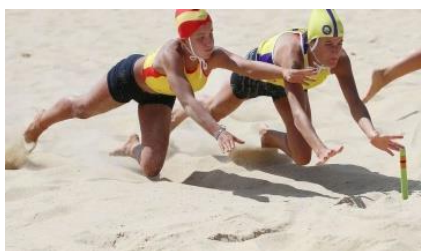
Beach flags (bâtons musicaux)