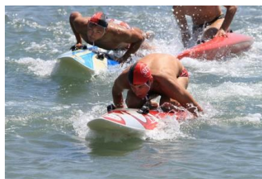
Board race (course de prone paddle)