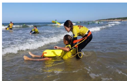
Rescue race (course de bouée tube)